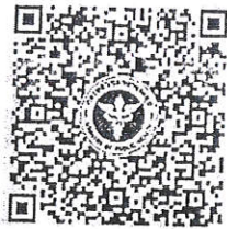
แบบรายงานข้อมูลพื้นฐาน และการดำเนินงาน

- กองสนับสนุนระบบสุขภาพปฐมภูมิ ใช้ข้อมูลในแบบรายงานข้อมูลพื้นฐานและการดำเนินงาน ตามแบบฟอร์ม Google Sheet ร่วมกับฐานข้อมูลการขึ้นทะเบียนหน่วยบริการปฐมภูมิสรุปข้อมูลทุกวันศุกร์ เพื่อรายงานความคืบหน้าให้ผู้บริหารทราบรายสัปดาห์