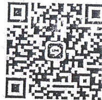
Line กลุ่ม: สอน.